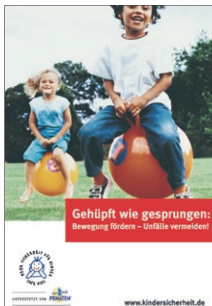
4. Plakat Kindersicherheitstag 2005