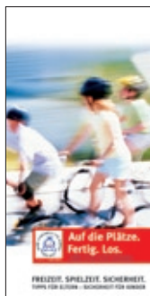
12. Flyer Freizeitunfälle