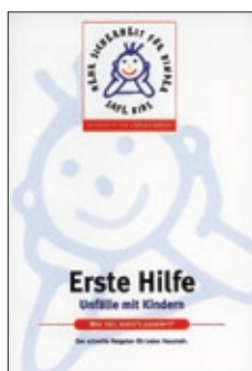
5. Erste Hilfe Brochure