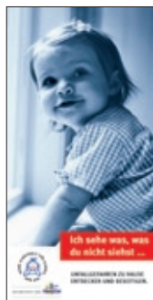
11. Flyer Haushalts- unfälle