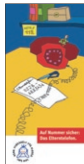
15. Flyer Eltern-Hotline