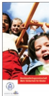
14. Flyer Selbstdar- stellung BAG