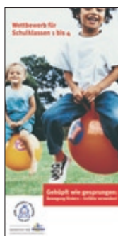
3. Flyer Grundschul- Wettbewerb 2005/2006