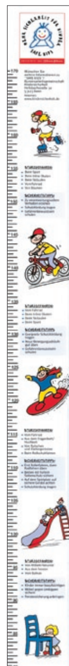
16. Safe Kids Maßband