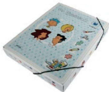
9. Spielbox für Kindergarten- Kinder