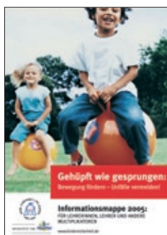
2. Infomappe für Lehrer und Multiplikatoren