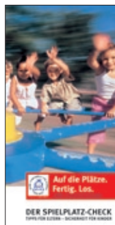
13. Flyer Spielplatz- Check für Eltern