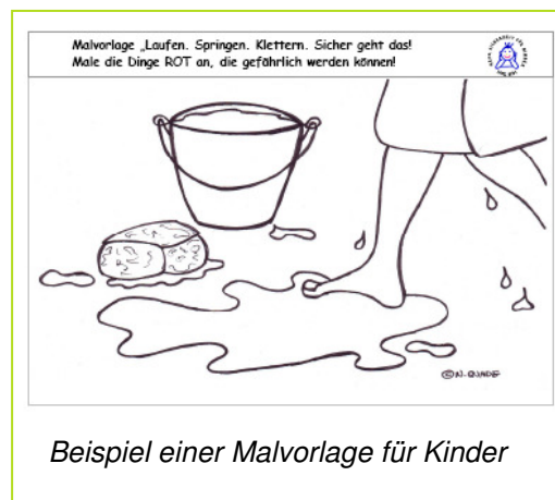
Beispiel einer Malvorlage für Kinder

Schnell und einfach als Download erhältlich: