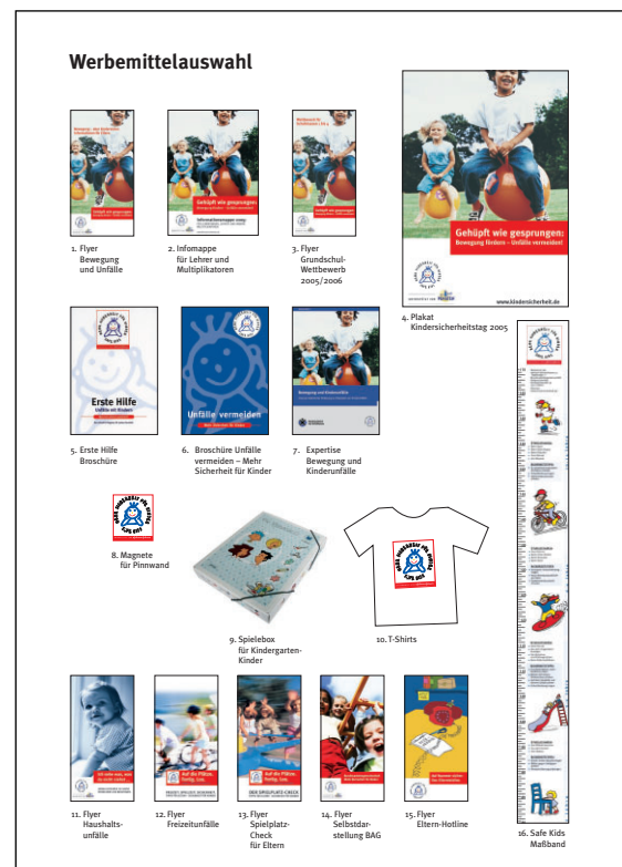
Werbemittelauswahl 2005 der BAG

Die Broschüre „Kindersicherheit von A-Z“ konnte mit Unterstützung des Gesundheitsministeriums in Rheinland-Pfalz neu aufgelegt werden. Diese Broschüre wird im Zusammenhang mit dem Projekt „Kindersicherheit für die Kleinsten“ an Eltern verteilt.