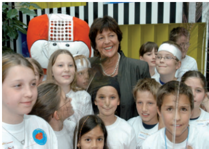
Nach der Bühnenshow

Bei der Bühnenshow, an der auch Bundesgesundheitsministerin Ulla Schmidt aktiv teilnahm, zeigten einige Schulklassen eine beeindruckende Performance, die in zwei Schulstunden vorab mit einer Zirkuspädagogin einstudiert wurden.