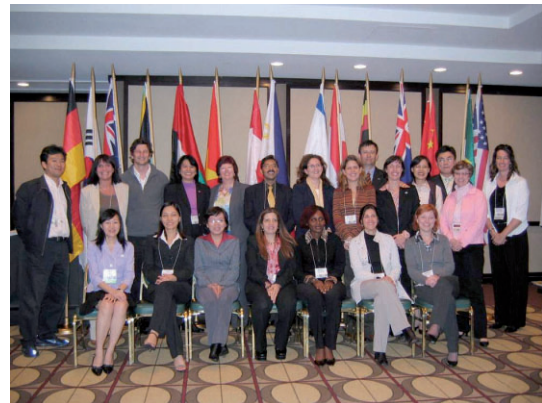
Vertreter von Safe Kids Worldwide