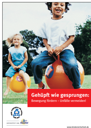
Poster zum Kindersicherheitstag 2005

Hintergrund für die Auswahl dieses Themas war, dass Kinder zunehmend über zu geringe oder auch zu wenig vielfältige Bewegungserfahrungen verfügen. Dies begünstigt die Entstehung von Unfällen mit zum Teil schweren Verletzungsfolgen. Mit dem Kindersicherheitstag 2005 verfolgte die BAG das Ziel, bei Eltern und Multiplikatoren das Bewusstsein für die Vermeidbarkeit von Unfällen zu wecken und den positiven Beitrag der Bewegung für die Unfallverhütung zu vermitteln, damit die Zahl und die Schwere der Kinderunfälle verringert werden können.