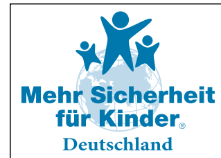
Neues Logo der BAG ab Ende 2006

schlagene Vereinheitlichung des Logos und des Corporate Designs von allen weltweit im Netzwerk mit arbeitenden Institutionen. Die Vor- und Nachteile für die BAG wurden kontrovers diskutiert. Fazit ist, dass die BAG unter der Voraussetzung, dass einige rechtliche Fragen einvernehmlich geklärt werden können, voraussichtlich im September 2006 die Logoumstellung vornehmen wird.