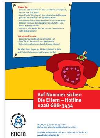
Poster zur Elternhotline

Das Angebot der Eltern-Hotline wird sehr gut angenommen. Bis Ende 2005 wurden 520 Anrufe erfasst. Unter den Anrufergruppen nehmen die Eltern den mit Abstand größten Teil ein. Fragen kommen auch von Erzieher/innen, Ärztinnen und Ärzten, Journalistinnen und Journalisten oder Architektinnen und Architekten. Die Nachfragen kommen aus dem gesamten Bundesgebiet, jedoch überwiegend aus Nordrhein Westfalen, Baden-Württemberg, Niedersachsen, Rheinland-Pfalz und Berlin.