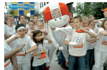
Aktionenstand mit Helmi

Die Veranstaltung gliederte sich in zwei Teile, zum einen ein Sicherheitsparcours mit verschiedenen Übungen und zum anderen eine Bühnenshow.